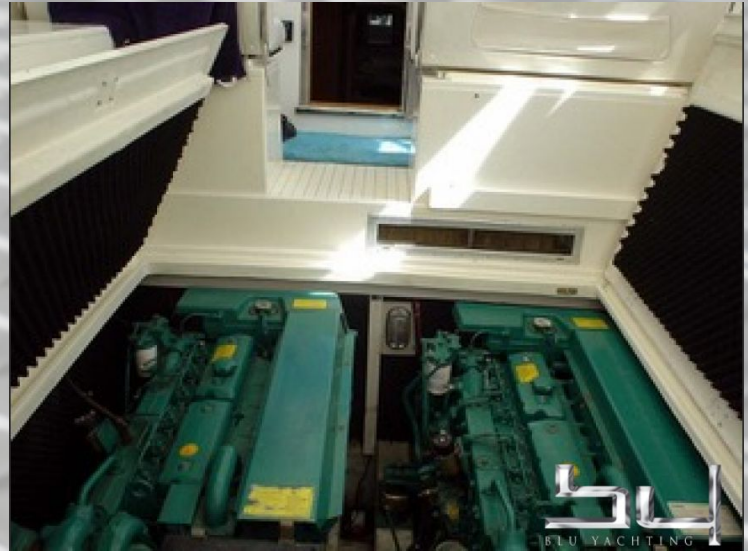
vista exterior - Imagen 8