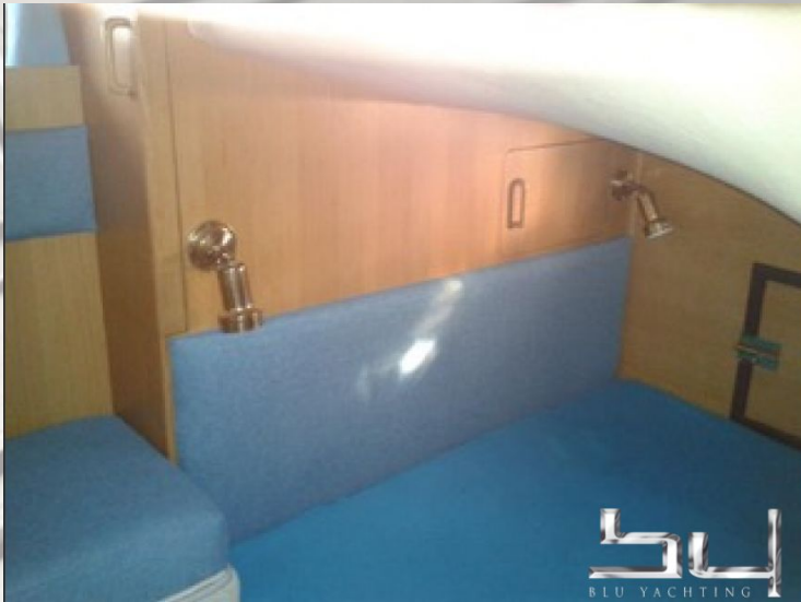
vista exterior - Imagen 3