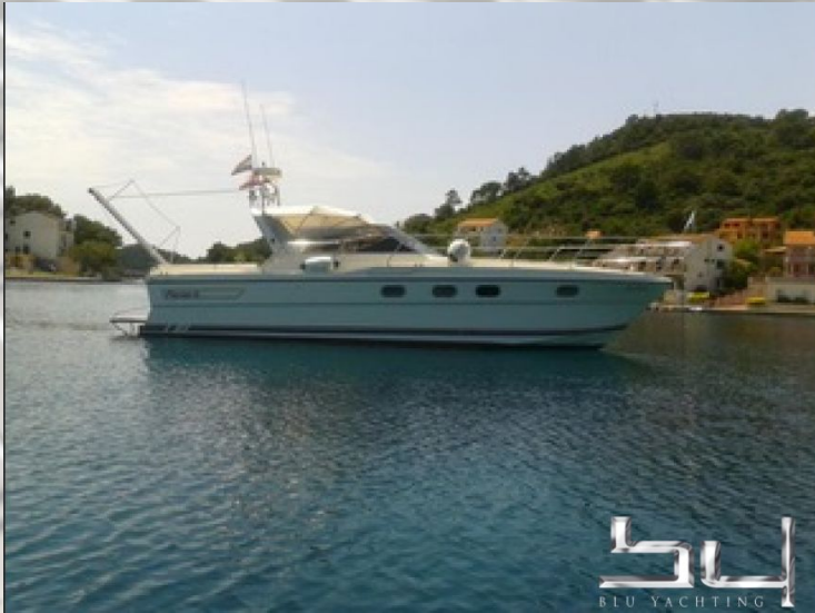
vista exterior - Imagen 1