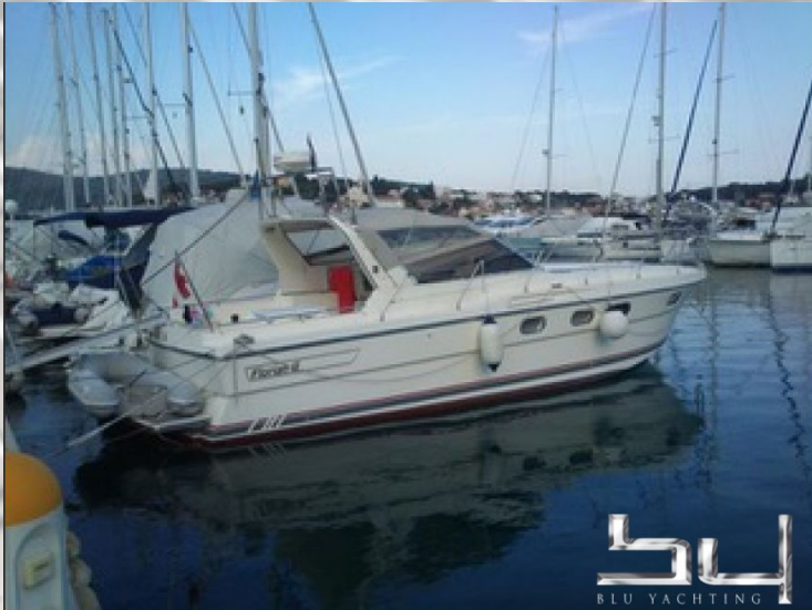
vista exterior - Imagen 7