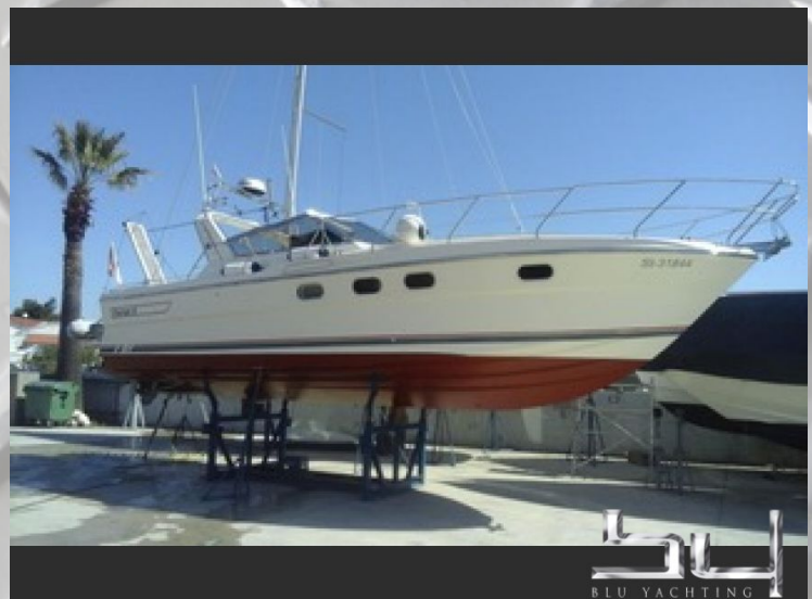
vista exterior - Imagen 6