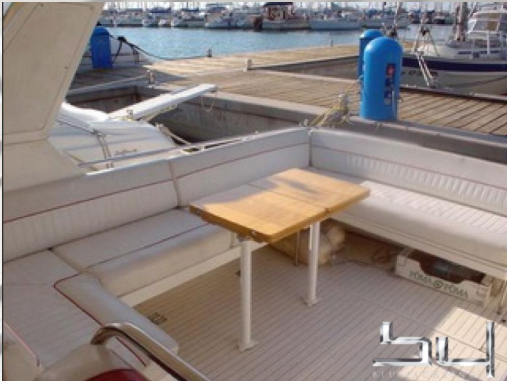
vista exterior - Imagen 9