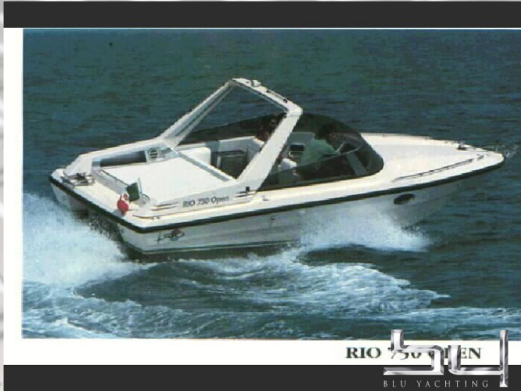
vista exterior - Imagen 1